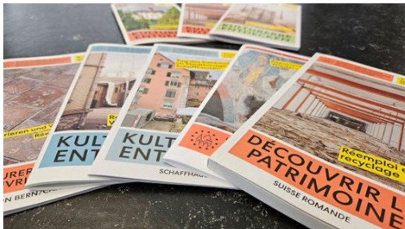
Des brochures cantonales et régionales des Journées européennes du patrimoine 2023, avec leur nouveau design homogène.