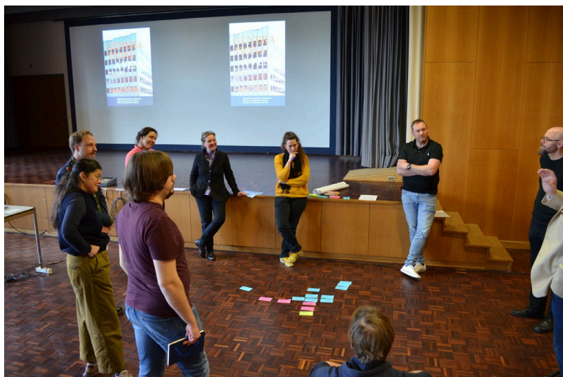
Moment de discussion lors du colloque 2023 à la Haute école pédagogique de la FHNW à Soleure

Le Centre NIKE a pour la première fois placé régulièrement sur les médias sociaux des publications informant de ses activités et de celles de ses organisations membres ; il étoffe constamment sa communauté sur ces médias. En 2023, il a eu 510 abonnés et 27 167 vues organiques sur LinkedIn. Depuis novembre 2023, le Centre NIKE est aussi présent sur Facebook ; il y compte 90 abonnés et a atteint 4827 vues organiques. En 2024, le Centre NIKE entend consolider et développer sa présence sur les médias sociaux afin de gagner en visibilité et de toucher un plus large public.