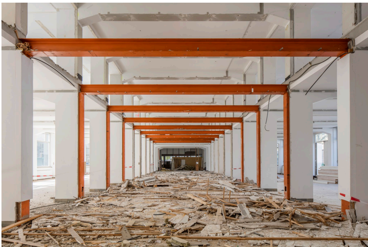
Les Journées européennes du patrimoine 2023, consacrées au thème « Réemploi et recyclage », étaient illustrées par une vue de la salle principale du Musée du design de Zurich. Un faux plafond datant des années 1950 vient d'être démonté dans ce bâtiment construit dans les années 1930.