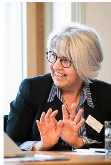
Élisabeth Baume-Schneider, présidente de l'Association du Centre NIKE en 2022