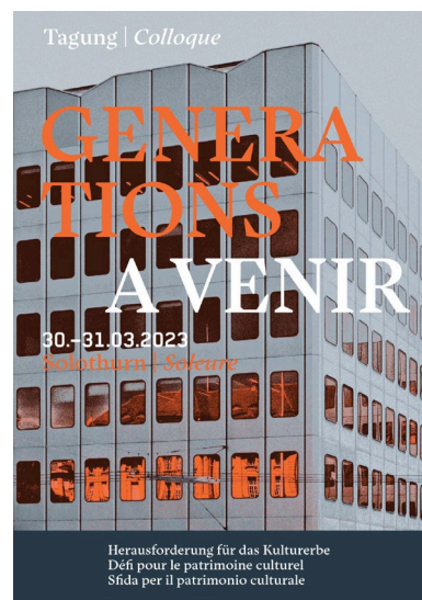
Dépliant pour le colloque « Générations à venir » Graphisme : Thomas Hirter