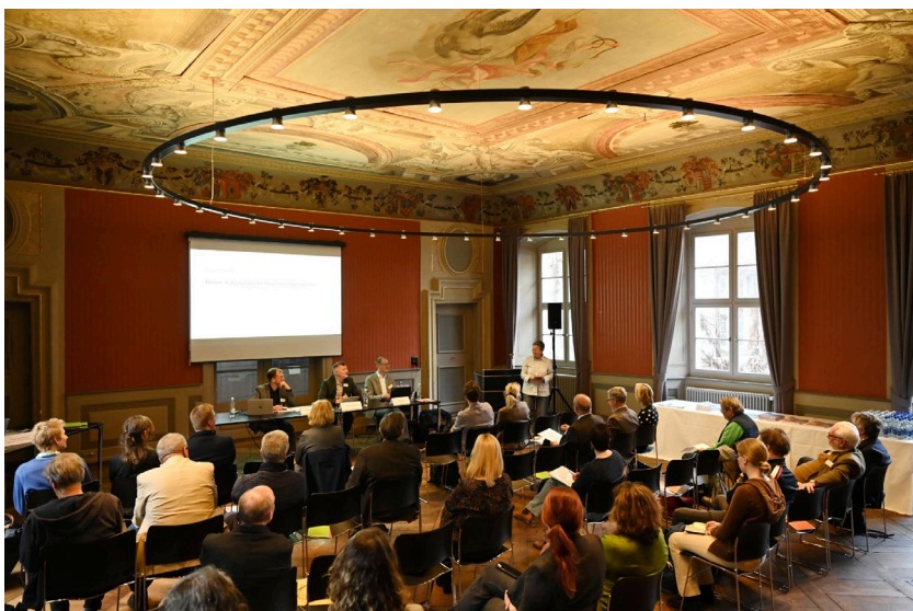
L'Assemblée générale de l'Association du Centre NIKE, le 31 mars 2023 dans la salle des chevaliers de la Maison von Roll, dans la vieille ville de Soleure.