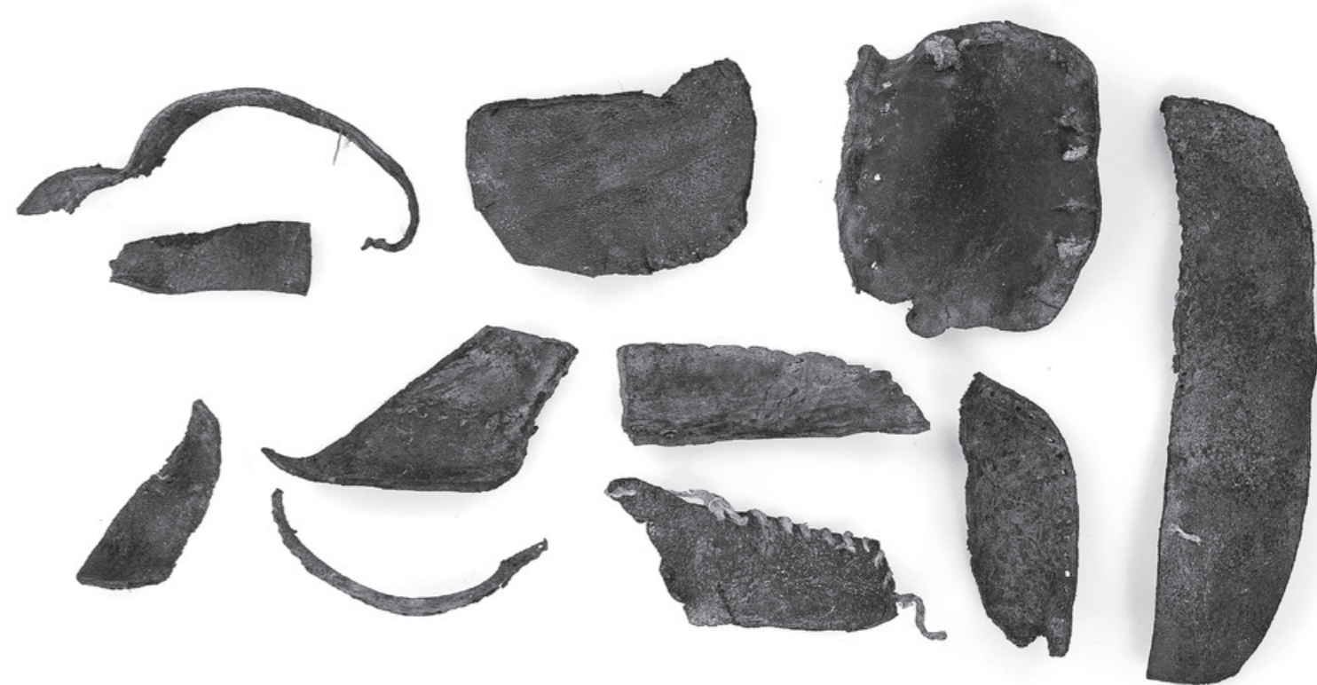
Abb. 1: Haus St. Oswalds-Gasse 10 in Zug: Lederschnipsel aus dem Raum 10 im ersten Obergeschoss, um 1500.