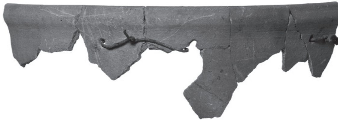
Abb. 4: Zylinderförmiges Kühlgefäss mit Flachwulstrand aus dem Bereich der Produktionshalle der Glashütte von Court. Zu beachten sind die teilweise aschegraue Oberfläche und die Flickungen aus Eisendraht.